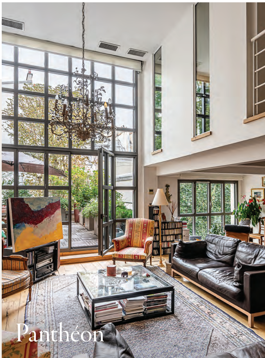
Au cœur du quartier Latin | Loft familial de 184 m 2 avec terrasse aménagée