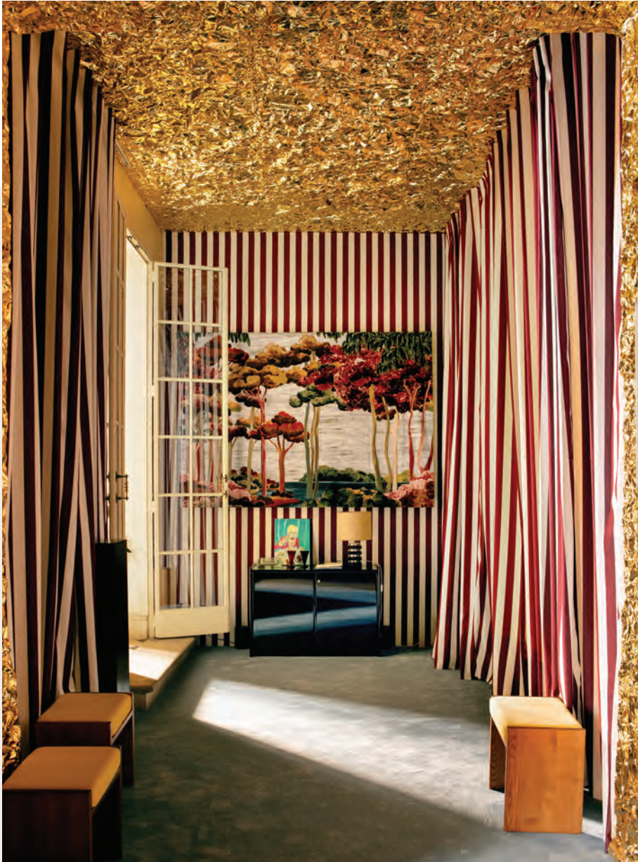
Collaboration Varenne x The Socialite Family | Paris Déco Off 2024