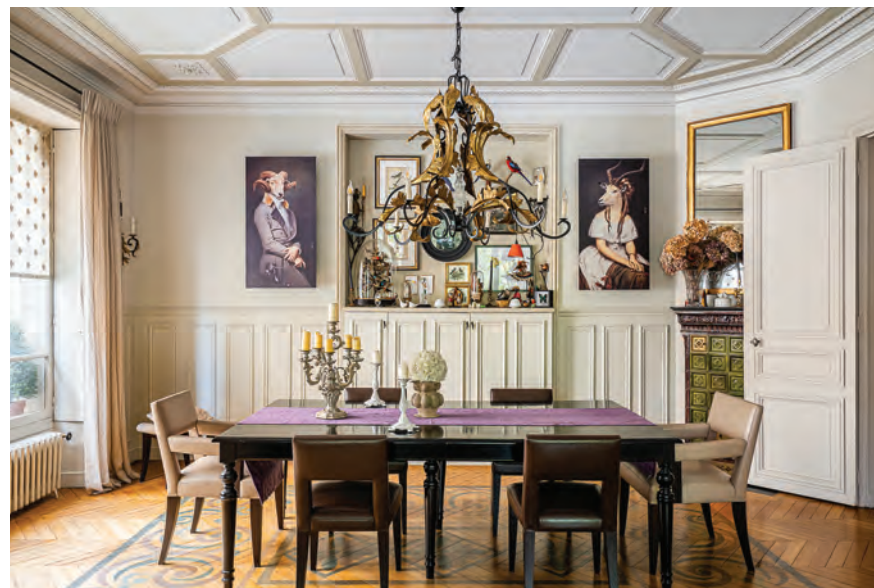
Appartement de 196 m 2 | Vues remarquables sur la fontaine Saint-Sulpice