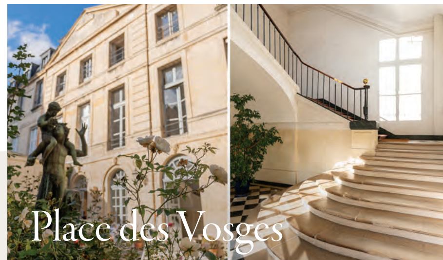
À l'étage noble d'un bel immeuble du XVII e | Élégant appartement de 180 m 2