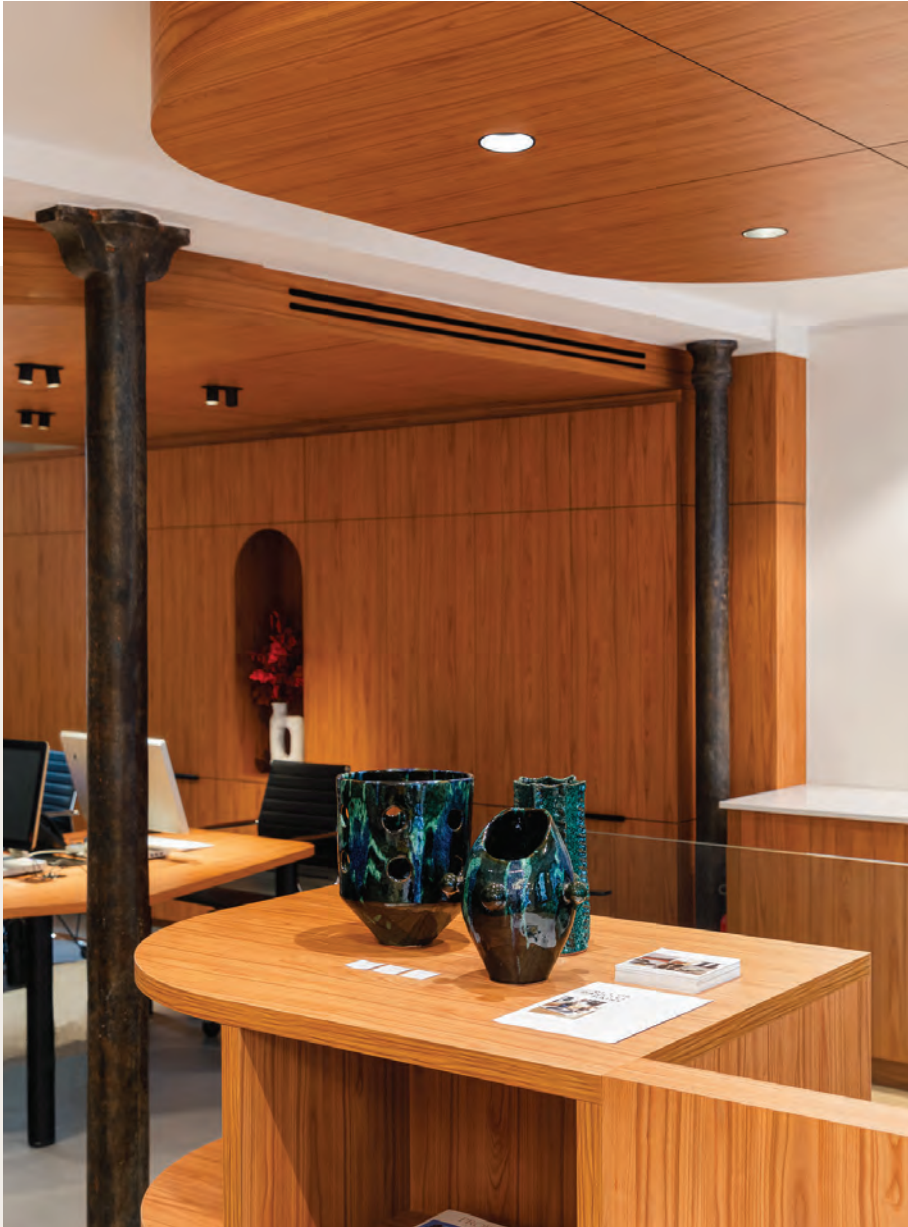
Varenne Babylone - 66 rue de Babylone, Paris 7 e