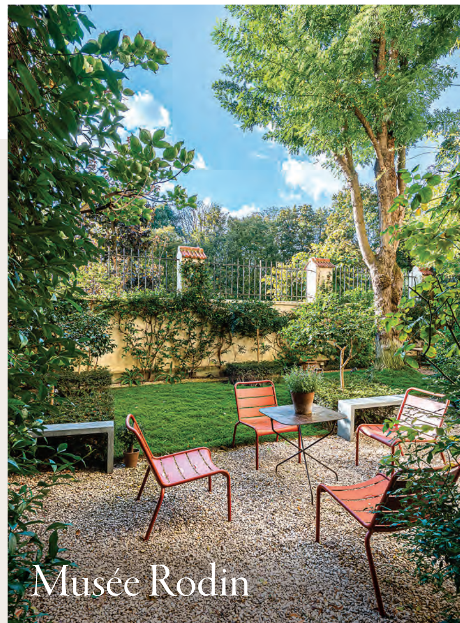
Vendu | Appartement de 234 m 2 en duplex avec jardin privatif de 85 m 2

They embody the very essence of Paris, combining history, culture and prestige, and are still the epitome of the Parisian dream for many buyers and investors.