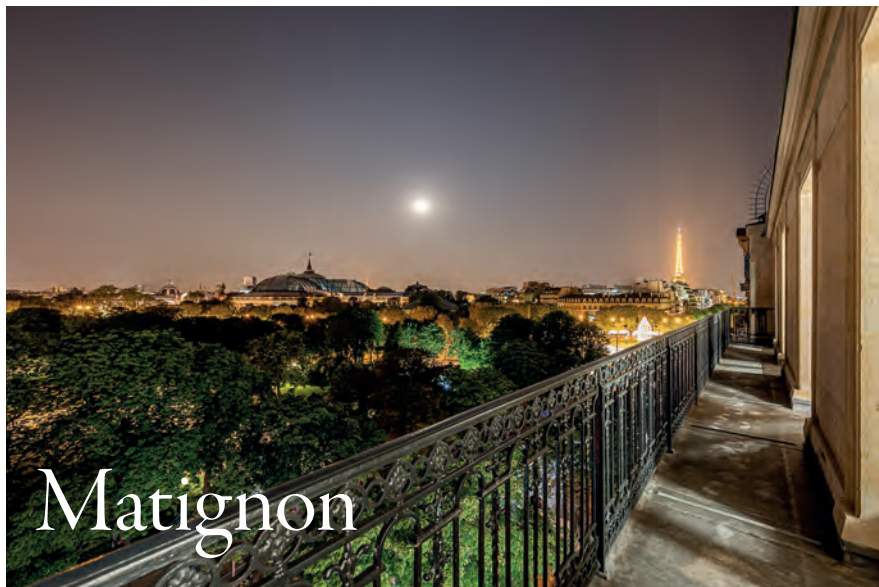
Appartement de 240 m 2 | Vue sur les monuments emblématiques de Paris