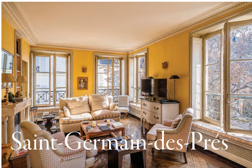
Appartement de 95 m 2 | Vue sur la place de Fürstemberg