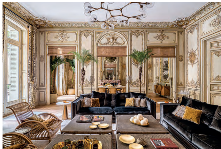
En rez-de-jardin d'un ancien hôtel particulier du XIX e | 488 m 2 | Terrasse de 50 m 2