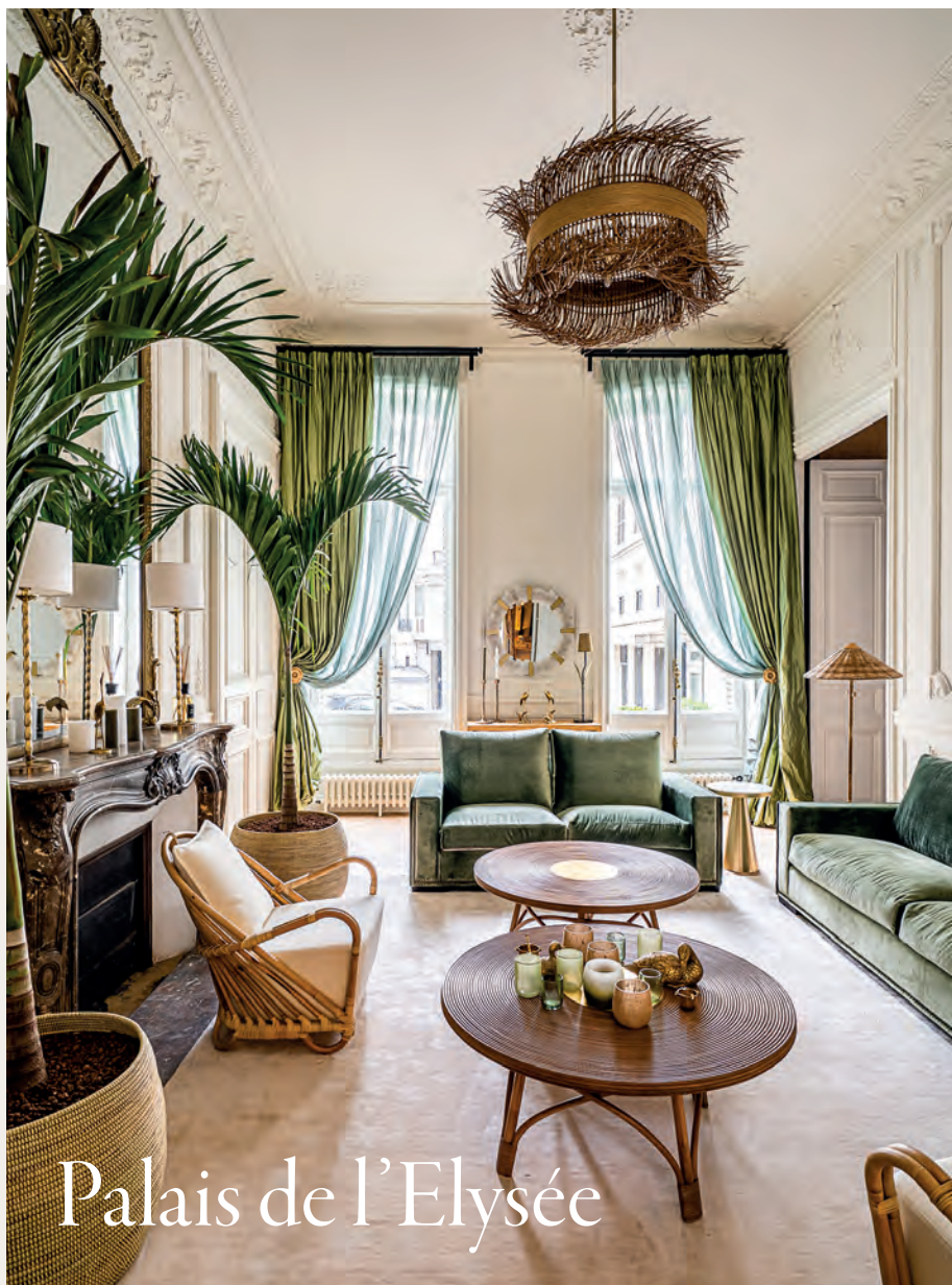
Palais de l'Elysée