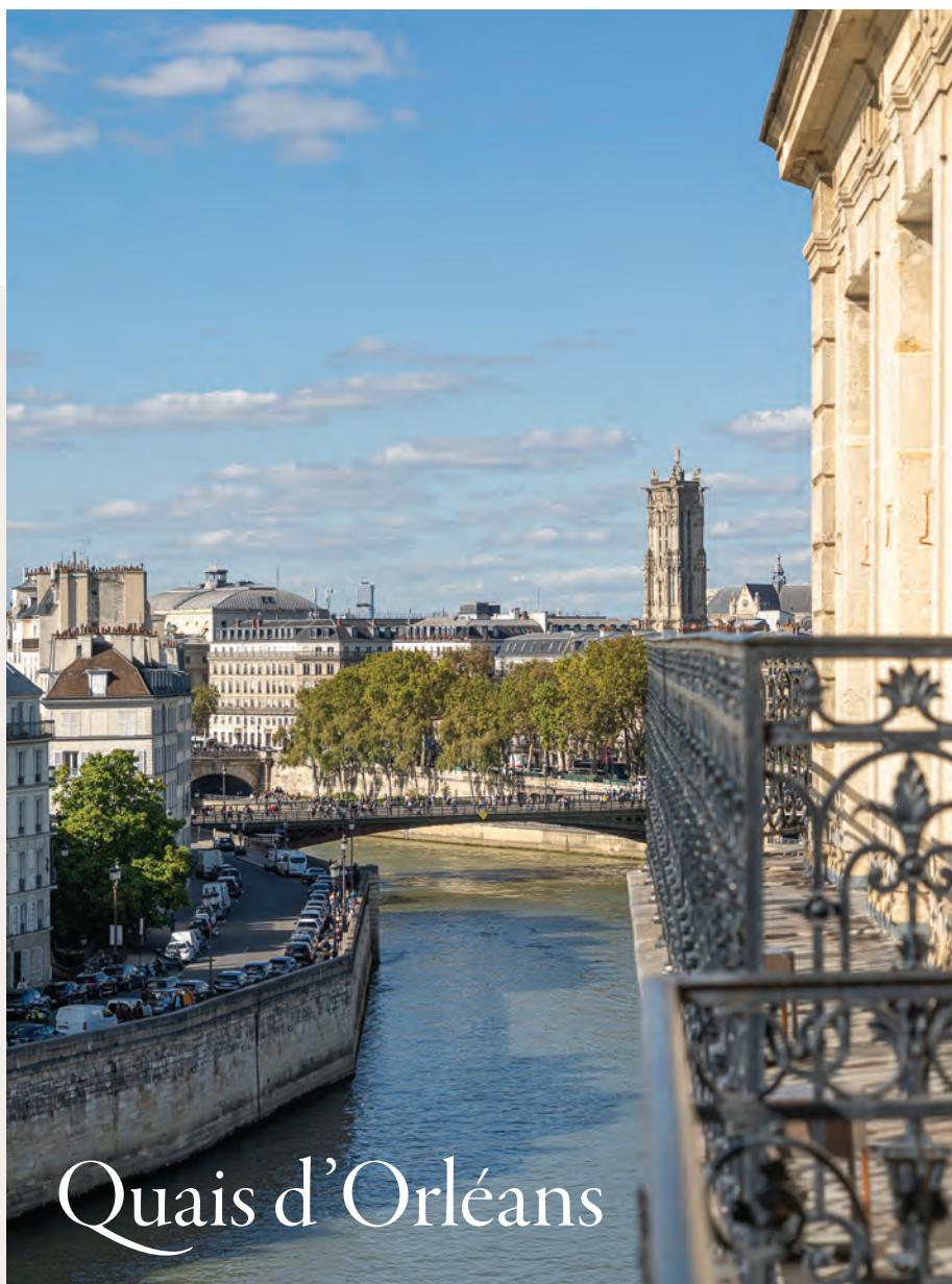
Île Saint-Louis | Appartement d'exception avec des vues remarquables

Cette rive est celle de la diversité et des contrastes qui font le bonheur de la cité. L'immobilier haut de gamme et d'exception se décline autour de multiples expressions.