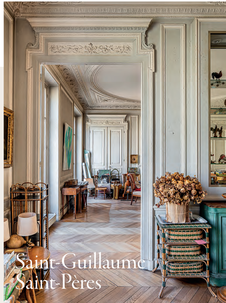
À deux pas du café de Flore | Appartement familial de 242 m 2